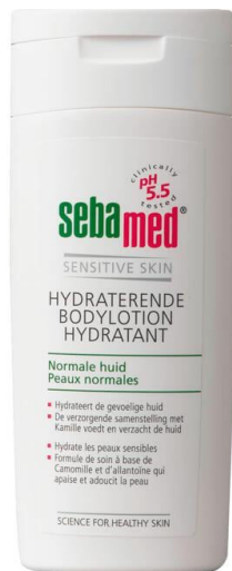
De Sebamed Hydraterende Bodylotion