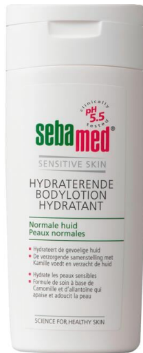
De Sebamed Hydraterende Bodylotion